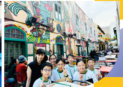
新加坡環保科技遊學團