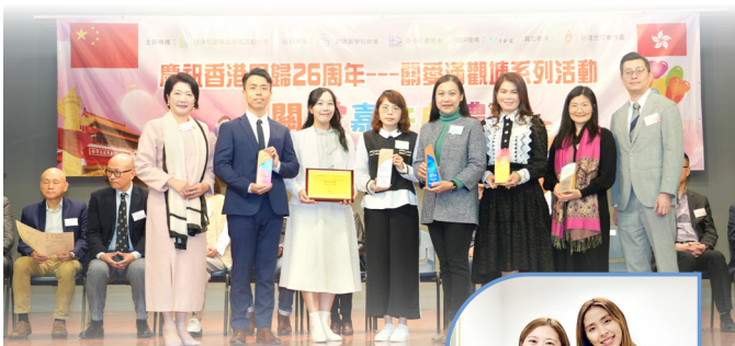
於「關愛滿觀塘」 榮獲五項關愛殊榮