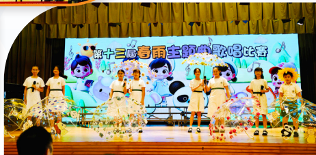
第十三屆「春雨主題曲歌唱比賽」