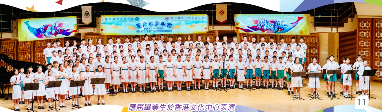
應屆畢業生於香港文化中心表演