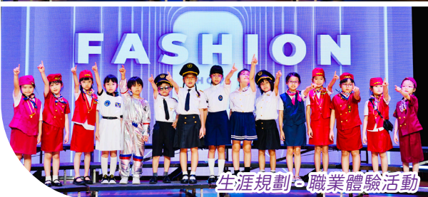
生涯規劃·職業體驗活動