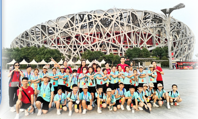
北京歷史文化遊學團