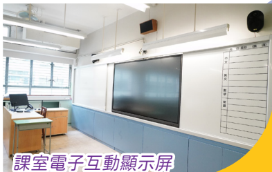
課室電子互動顯示屏