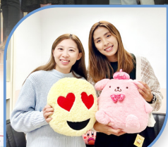
既專業又和藹可親的社工