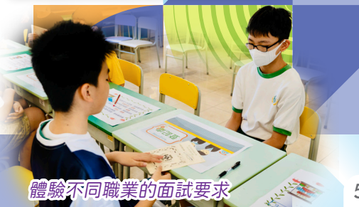
體驗不同職業的面試要求