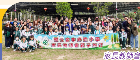
家長教師會親子旅行

每年家長教師會均舉行親子旅行，校長、老師、家長和孩子在當天玩得樂而忘返，一起共度愉快而充實的時光。