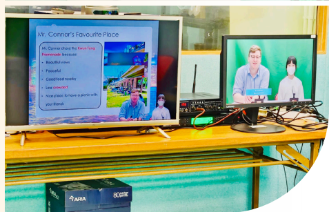
English morning assembly